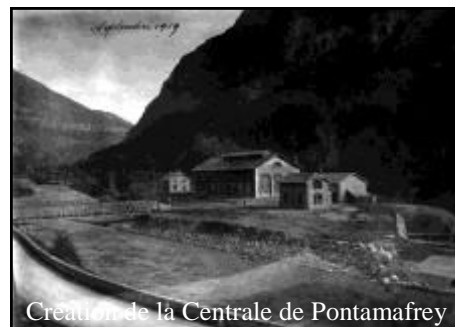
Création de la Centrale de Pontamafrey