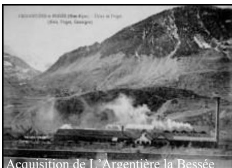
Acquisition de L'Argentière la Bessée