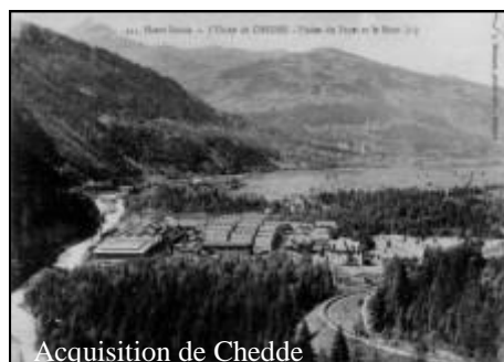
Acquisition de Chedde