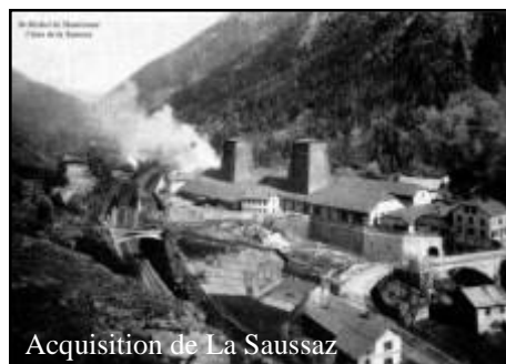
Acquisition de La Saussaz