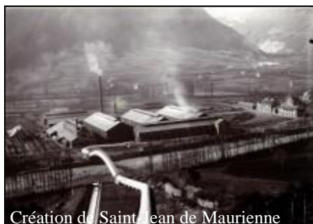
Création de Saint-Jean de Maurienne